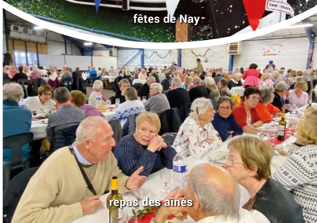
repas des aînés