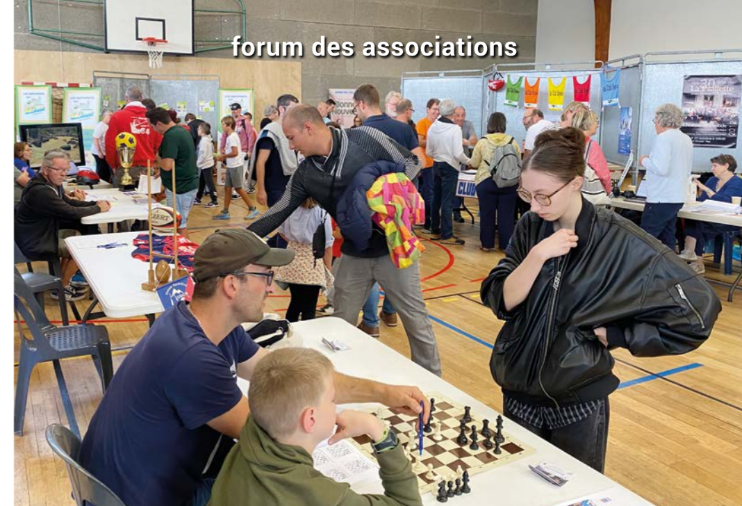
forum des associations