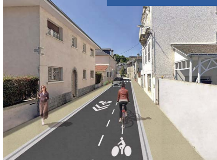
Projet de travaux de la rue du Général Leclerc