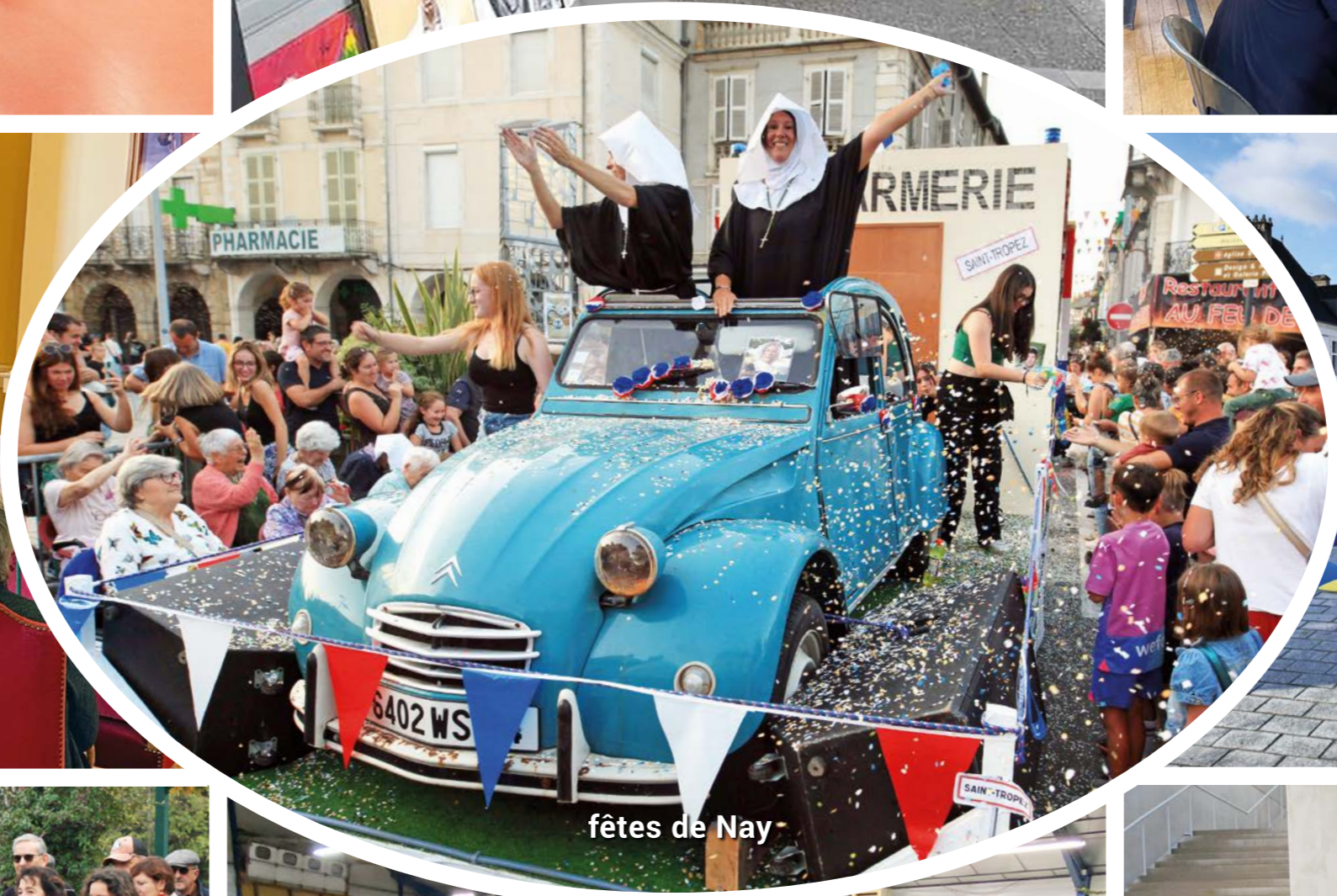
fêtes de Nay