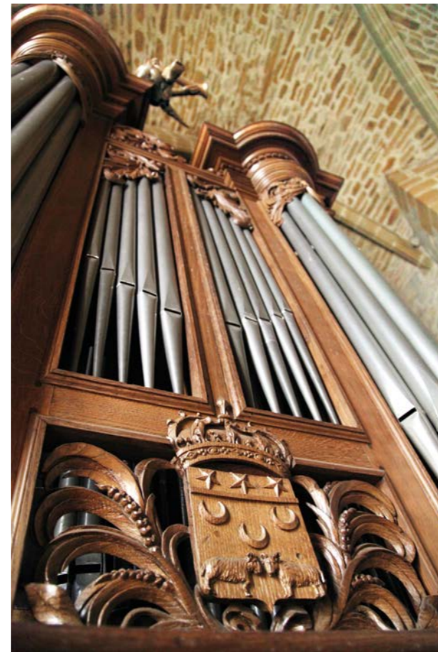
Le blason de Nay sur l'orgue de l'église Saint Vincent de Nay