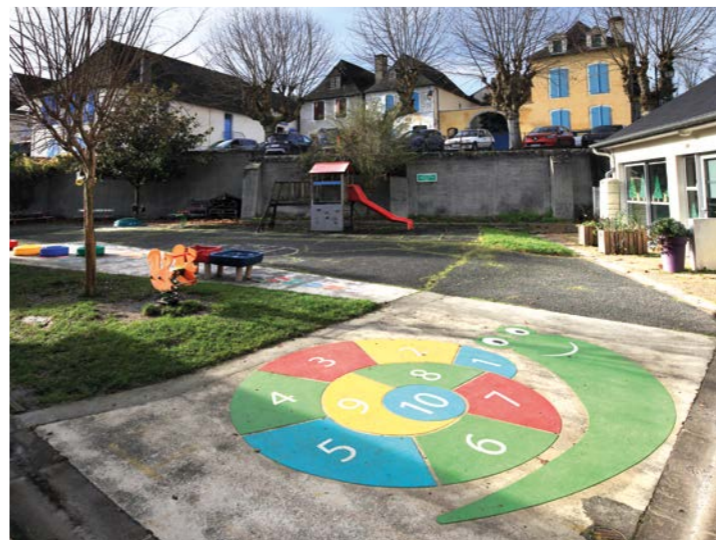
Nouveaux jeux et rénovation des salles à l'école maternelle de la Fontaine d'Argent