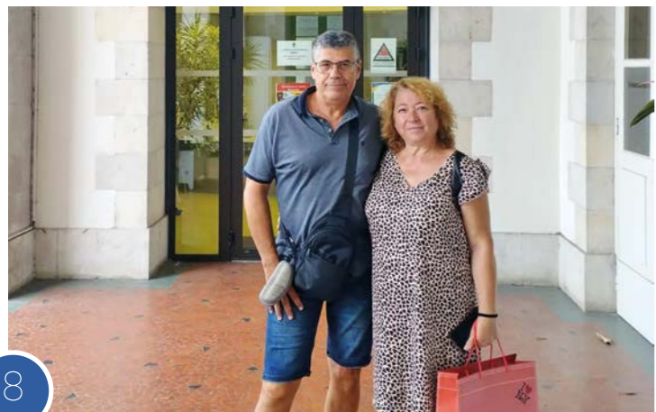
Moroneros à Nay

Le moment venu, vous serez informés du programme des manifestations auxquelles vous serez tous conviés. Mais, d'ores et déjà, nous vous donnons rendez-vous au printemps 2025 pour la 3 ème édition de la « Soirée Espagnole » et pour le « Loto ». Le Jumelage avance et si vous souhaitez apporter vos idées, votre pierre à l'édifice, n'hésitez pas à venir nous rejoindre !