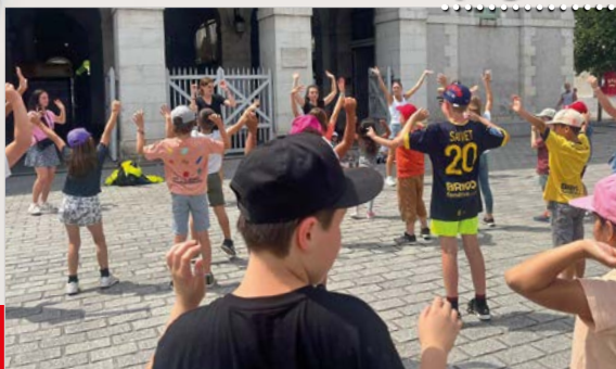
service enfance & jeunesse