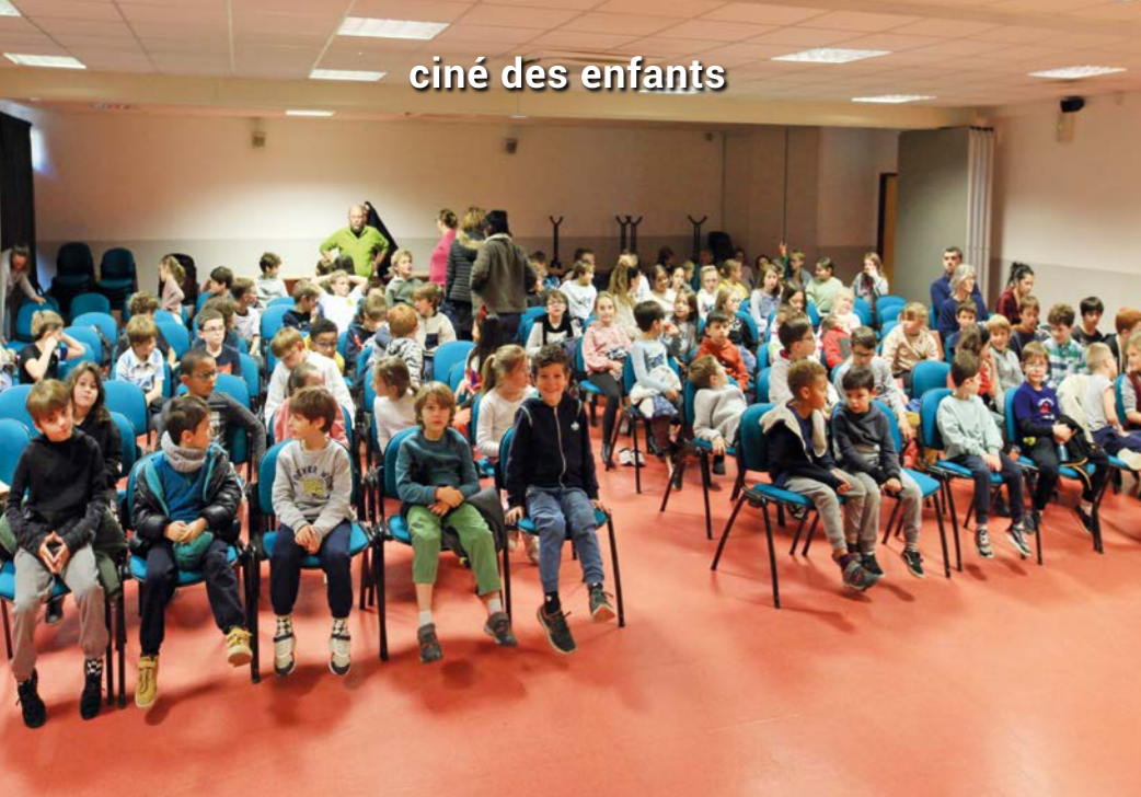
ciné des enfants