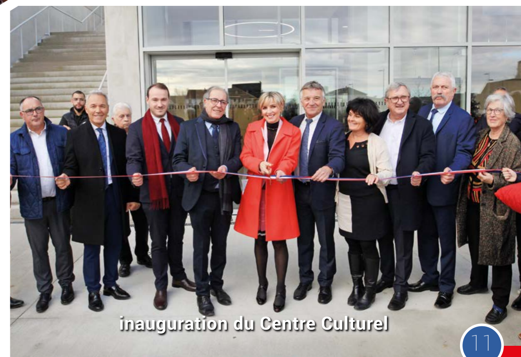
inauguration du Centre Culturel