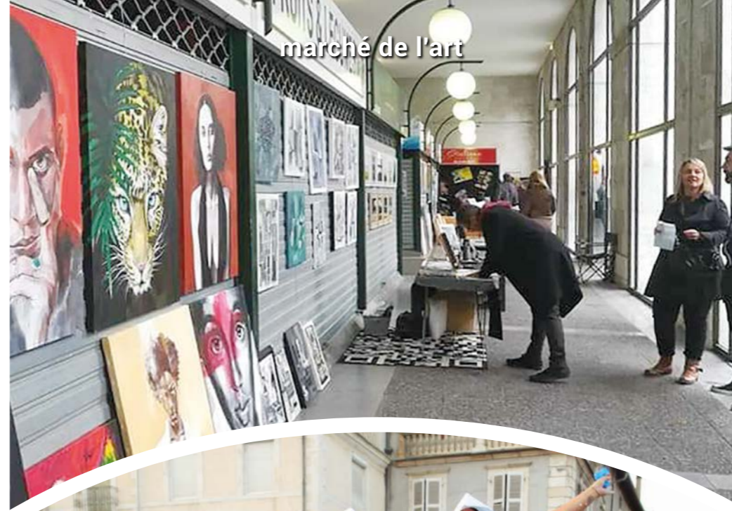
marché de l'art