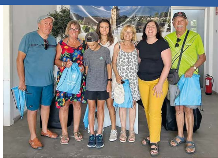
Des nayais à Sant Joan

La programmation du cinéma est consultable sur : www.cineode.fr