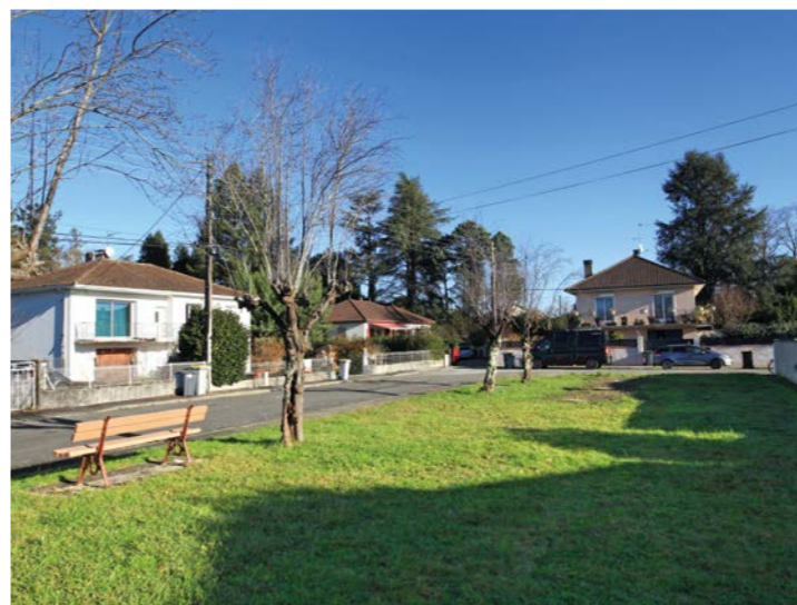
Ouvrages d'infiltration des eaux pluviales rue de L'Ouzom