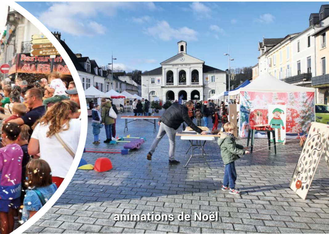
animations de Noël