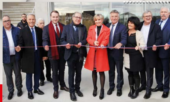
inauguration du Centre Culturel